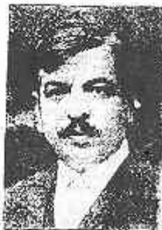
Le président Pierre LAVAL.

« Vous pouvez rendre aux combattants le bien que vous avez reçu d'eux. C'est la relève qui commence !... »