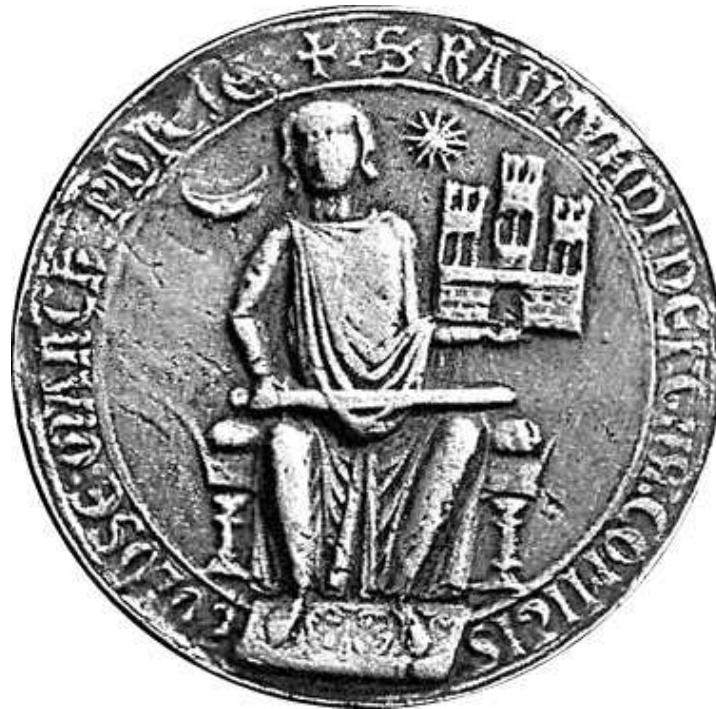
Sceau de Raimond VII de Toulouse de 1243 (avers)

A l'issue de la croisade contre les cathares, il doit signer le traité de Paris en 1229 qui prévoit que le comté deviendra propriété du roi de France si Raimond VII n'a pas d'héritier mâle.